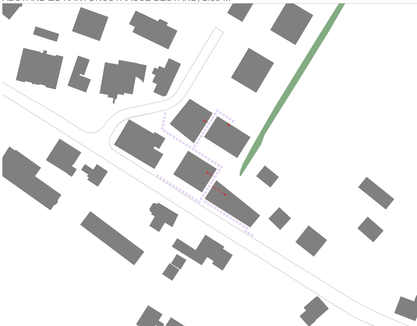
EIN ÖFFENTLICHER FUSSGÄNGERWEG ERMÖGLICHT EINE QUERVERBINDUNG VON DER KANTONSSTRASSE ZUR STRASSE "ZUR KÄSEREI"