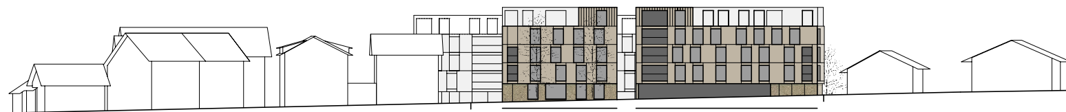
ANSICHT KANSTONSSTRASSE, EINBINDUNG IN DIE SILHOUETTE DER KERNZONE

ES WIRD EINE ZEITGEMÄSSE STÄDTEBAULICHE AUSSAGE ZUR KANTONSSTRASSE HIN GEMACHT