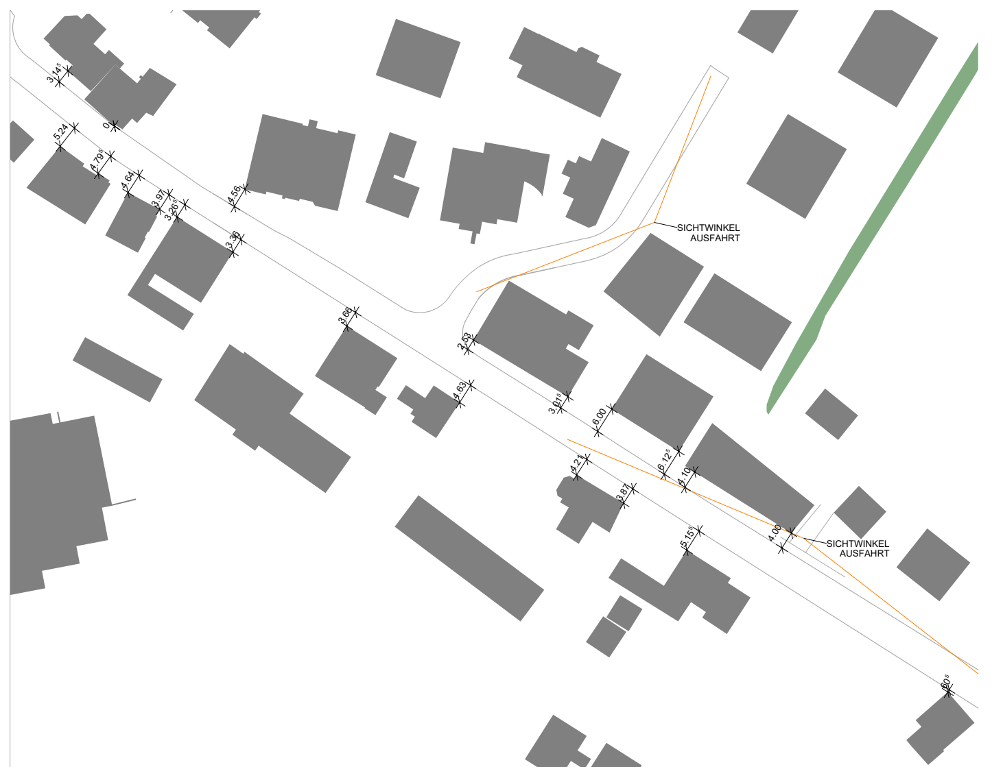
ABSTAND ZU KANTONSSTRASSE PROJEKT, 4 RSP. 6 M