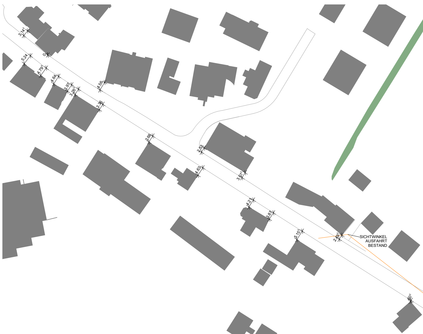
ABSTAND ZU KANTONSSTRASSE BESTAND, 2.50 M