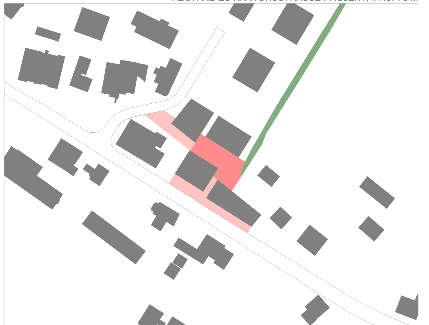
AUSSENRAUMKONZEPT, DER FUSSGÄNGER WIRD VOM STRASSENRAUM ABGEHOLT (HELLROT) LÄRMABGEWANDTER GESCHÜTZTER HOFRAUM (ROT)